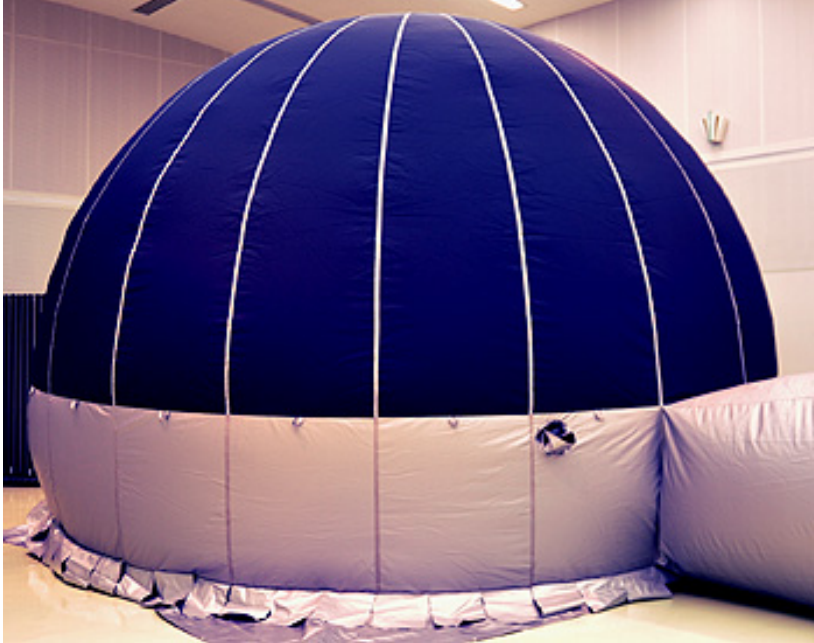
国内生産生地、国内で製造・縫製！