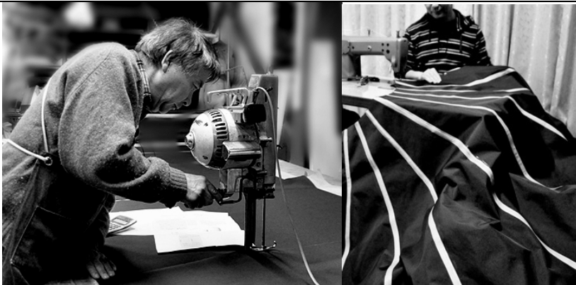
海外で生産された製品が多い中、国内での製造にこだわりました。